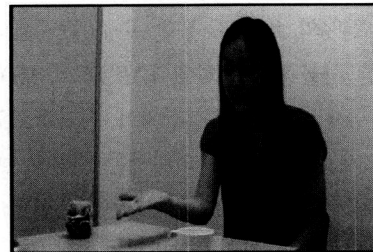
그림 2. 실험 3의 장면의 예

실험 3에서는 실험 1, 2와 달리 사회화용적 단서로 시선 단서를 사용하였다. 실험자는 친숙한 사물을 바라보며 새로운 단어를 말하거나(단어 조건: “고디 줌 줄래?”), 중립적인 표현(통제 조건: “줌 줄래?”)을 하였다. 친숙한 사물을 바라볼 때에는 고개를 함께 돌려서 시선의 방향이 명확히 파악될 수 있도록 하였다. 각 시행이 시작되면 실험자는 먼저 고개를 돌려 친숙한 사물을 바라보면서 실험 문장을 말하였고, 동시에 오른쪽 손바닥을 테이블 위로 펼쳤다(그림 2). 총 6회의 시행이 실시되었고 행동 단서로서 시선이 사용되었다는 것을 제외하면 모든 절차가 실험 1, 2와 동일하였다.